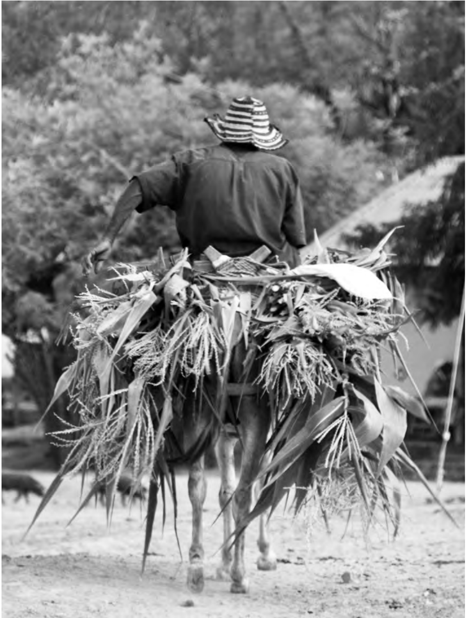
Oliver Emigh/Fundación Semana