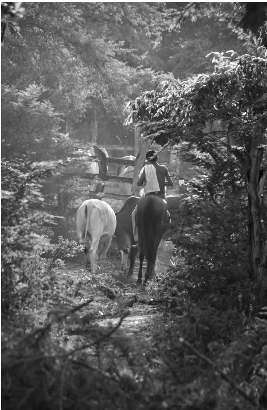
Oliver Emigh/Fundación Semana