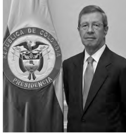
Juan Carlos Esguerra Portocarrero, Ministro de Justicia y del Derecho